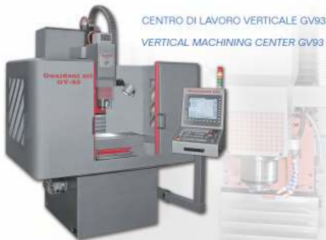
CENTRO DI LAVORO VERTICALE GV93