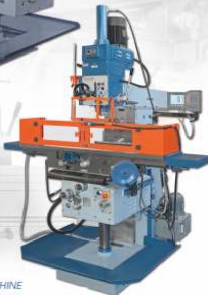
FRESATRICI UNIVERSALI UNIVERSAL MILLING MACHINE

UNIVERSAL MILLING MACHINE WITH SENSITIVE VERTICAL HEAD