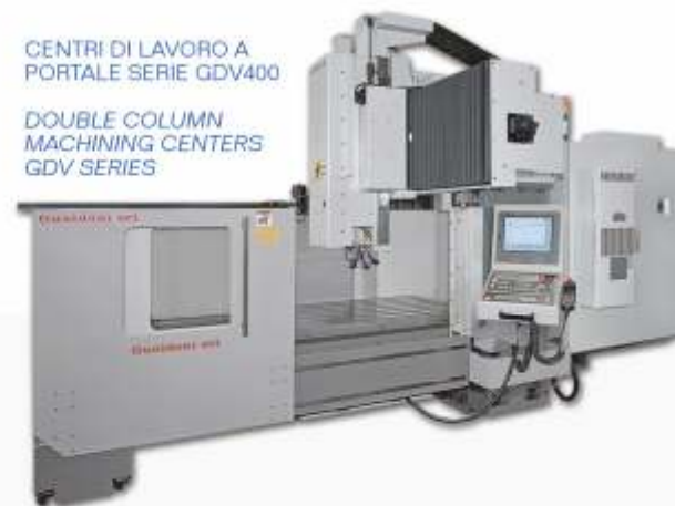
CENTRI DI LAVORO A PORTALE SERIE GDV400

DOUBLE COLUMN MACHINING CENTERS GDV SERIES