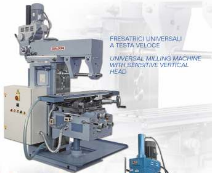
FRESATRICI UNIVERSALI A TESTA VELOCE

UNIVERSAL MILLING MACHINE WITH SENSITIVE VERTICAL HEAD