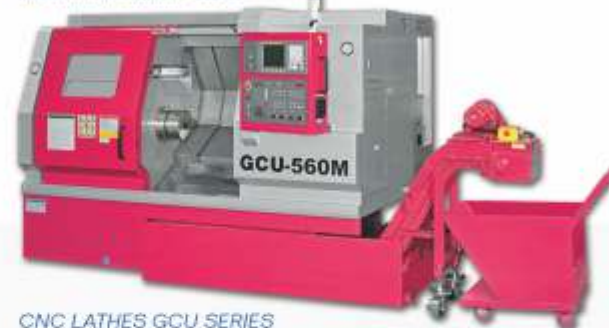
CNC LATHES GCU SERIES