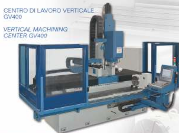
CENTRO DI LAVORO VERTICALE GV400